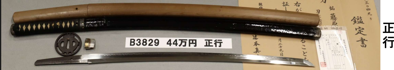
B3829 44万円 正行

さび、刃こぼれなし。板目に柂目交じり。互の目乱れ。金銀二重ハバキ。黒塗ツヤ鞘。丸形透かし茶釜図鉄ツバ。「藤原正行」。豊後(大分)代表の刀匠。銃砲刀剣研究会鑑定書。白鞘付。