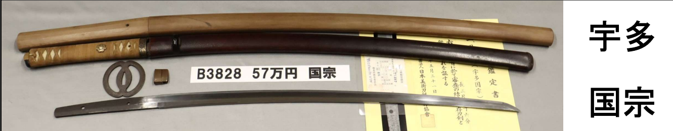
B3828 57万円 国宗

さび、刃こぼれなし。鑄造、庵棟。板目流れて柂がかかる。直刃乱れ。小切先。生茎。栗尻。銅ハバキ。朱色茶石目鞘。丸形透かし鉄ツバ。無銘(宇多国宗)。日刀保存鑑定書。白鞘付。