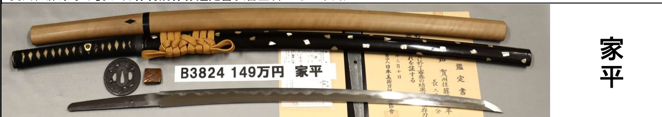
B3824 149万円 家平

さび、刃こぼれなし。小柰目肌。互の目がかり大乱れ。加州ハバキ。黒塗に約1cm角の貝散し鞘。丸形透かし鉄ツバ。白鞘付。「賀州住藤原家平」。日刀保特別保存鑑定書。(審査料三万五千元)