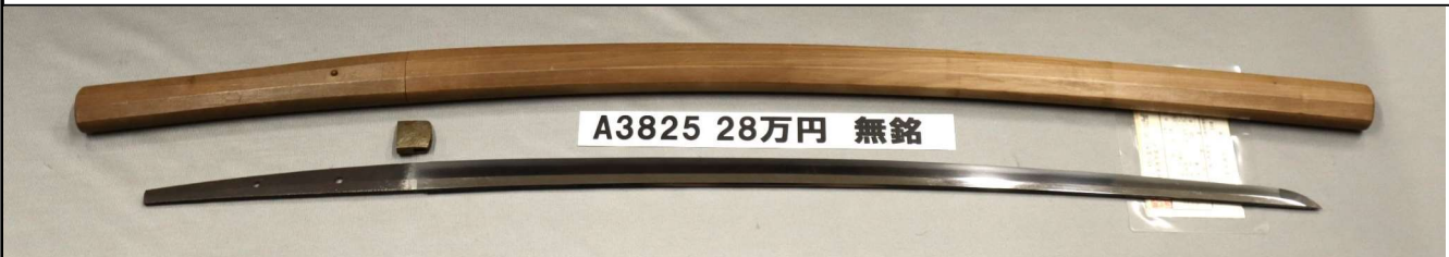
A3825 28万円 無銘

さび、刃こぼれなし。鑄造、庵棟。板目詰む。直刃に乱れ交じる。小切先。摺上茎。切。鉄味よくヤスリ目見えない。金色ハバキ。地鉄きれいな古刀。