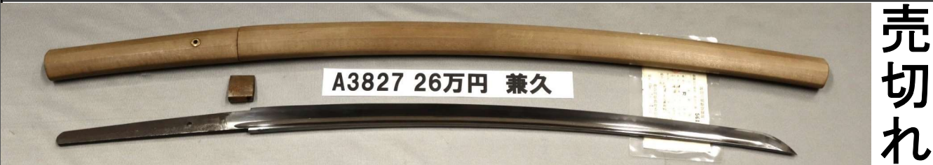
A3827 26万円 兼久

さび、刃こぼれなし。板目詰んで梨子がかかる。互の目丁子乱れ。生茎。栗尻。両面棒樋丸留め。鷹羽ヤスリ目。銅ハバキ。「大澤兼久作 刻印」。業物軍刀関の刀匠として有名。