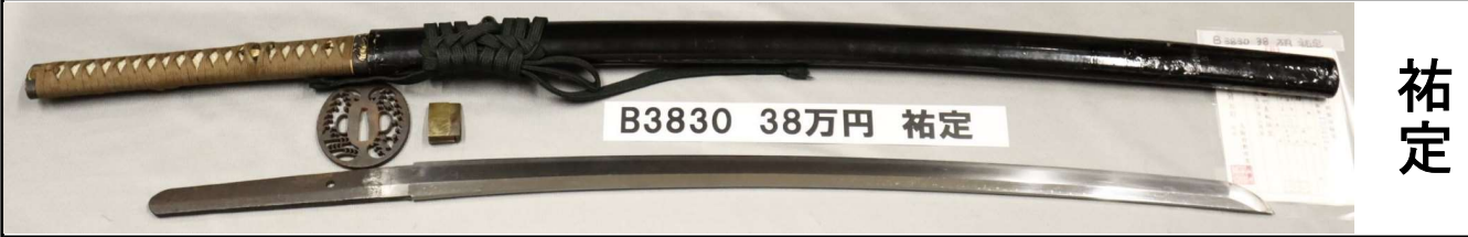
B3830 38万円 祐定

さび、刃こぼれなし。鑄造、庵棟。板目肌。乱れ交じり直刃。生茎。栗尻。黄銅二重ハバキ。黒塗ツヤ鞘。丸形透かし波図鉄ツバ。表「脩州長船祐定」。裏「天文亥年二月日」。信長、桶狭間の戦頃。