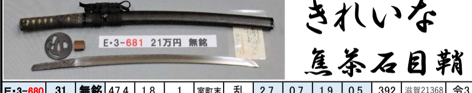
きれいな 焦茶石目鞘