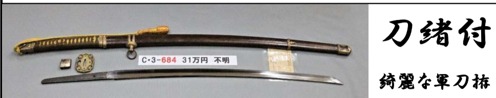
刀緒付 綺麗な軍刀拵

さび、刃こぼれなし。鑄造、庵棟。板目肌。直刃に湾れ交じり。小切先。大丸。生茎。栗尻。ヤスリ目みえず鉄味良し。祐乗ハバキ。白鞘状態良。