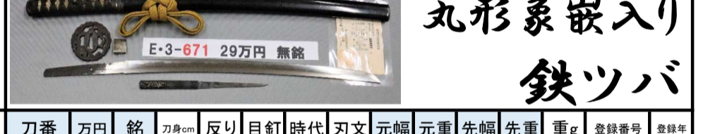
丸形象嵌入り 鉄ツバ