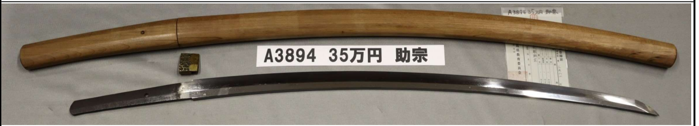
A3894 35万円 助宗

さび、刃こぼれなし。鑄造、庵棟。板目流れる。直刃に湾れ交じる。中切先。生茎。栗尻。ヤスリ目見えず。金色牡丹祐乗ハバキ。「備州長船助宗」。代表的な刀匠。