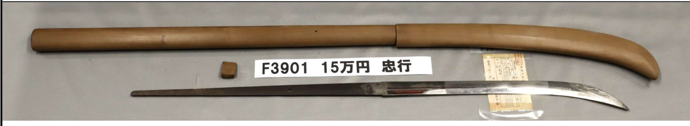
F3901 15万円 忠行

なぎなた。刃こぼれなし。両面朱漆塗棒樋丸留めに添樋。木ハバキ。茎から切先81.6cm。白鞘全長104cm。「忠行」。幅2.5cm、長さ17cmの試し研ぎあり。他はサビを取った跡あり。