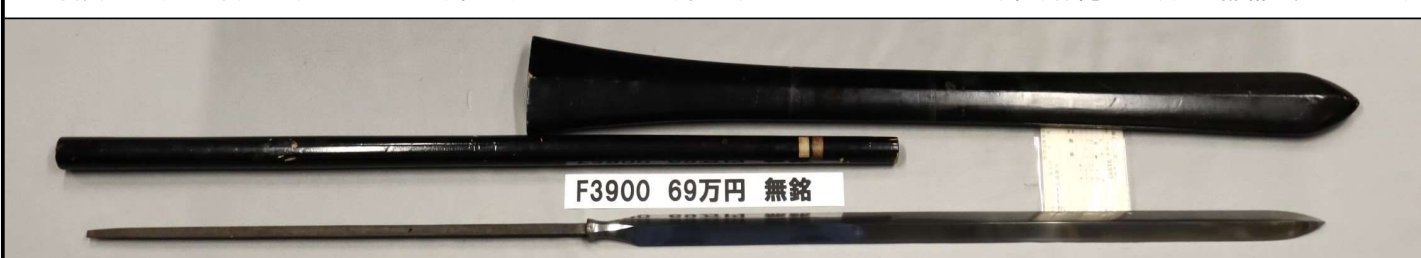
F3900 69万円 無銘

大身槍。別名黒田節。さび、刃こぼれなし。板目流れて杓がかかる。直刃。茎から切先まで130.5cm。裏、棒樋63cm。黒塗拵鞘全長176.5cm。