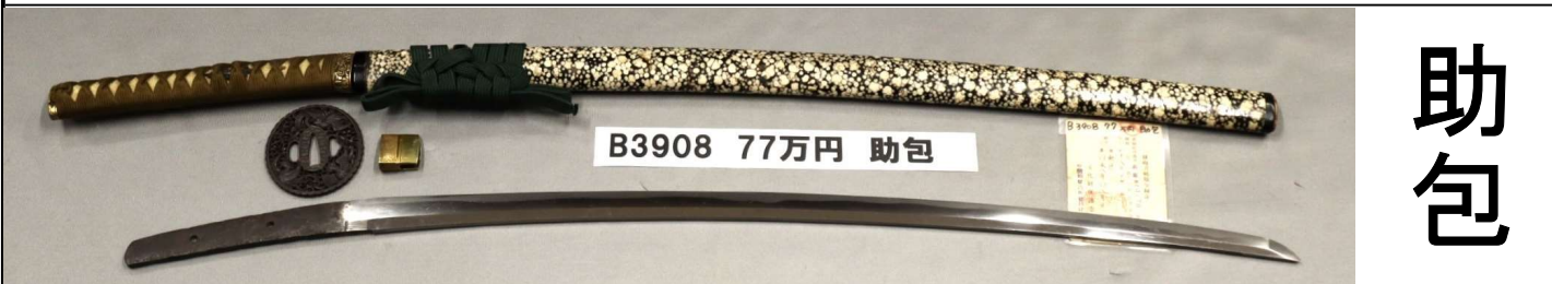
B3908 77万円 助包

さび、刃こぼれなし。板目に杓がかかる。鮮明な湾れ刃文。金着せハバキ。白貝散し変わり鞘。烏図丸形透かしツバ。表「助包」。裏「口永八年口月日」。