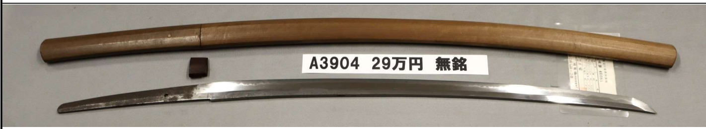
A3904 29万円 無銘

さび、刃こぼれなし。鎗造、庵棟。杓目肌。互の目乱れ続く。中切先。生茎。栗尻。鷹の羽ヤスリ目。木ハバキ。約70cm、居合刀に最適。